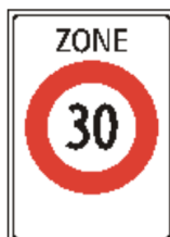
2.59.1 Signal de zone (p. ex. zone 30) (art. 2a et 22a)

Les panneaux suivants seront installés aux 6 points d'entrée :