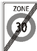
2.59.2 Signal de fin de zone (art. 2a)

Des potelets seront disposés le long de la Route de Provence afin de renforcer la sécurité des piétons.